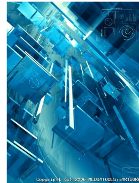
Exemple d'oeuvre marquée contre la copie

L'infrastructure devait offrir la possibilité de protéger valablement les oeuvres exposées contre la reproduction sauvage à l'aide de watermarks , assurant ainsi une certaine protection du copyright.