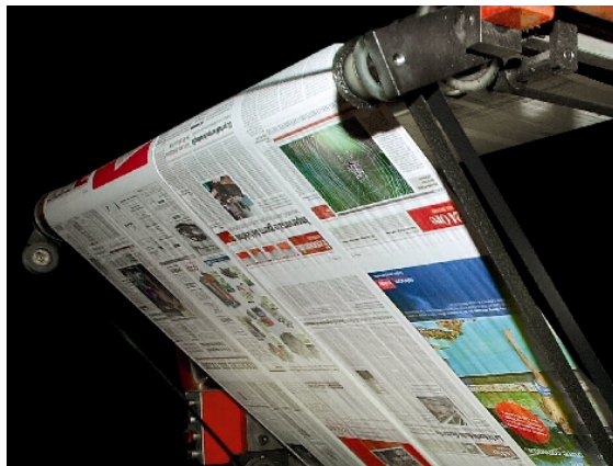
Rotative en production

L'alourdissement de la charge de travail dans le département presse de la «Società Editrice Corriere del Ticino SA» suite à l'intégration de l'impression du Giornale del Popolo a causé une diminution des temps à disposition.