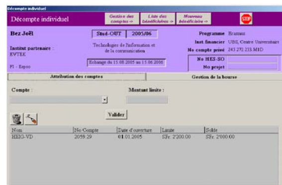
Interface d'un décompte personnel pour un bénéficiaire de bourse.

MoneyMove a été développé en VBA et SQL. Il fonctionne sous Access et partage les données communes avec MoveOn.