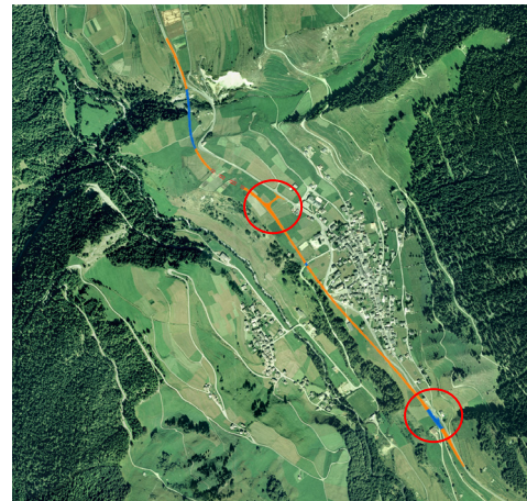
Tracé final de la route de contournement