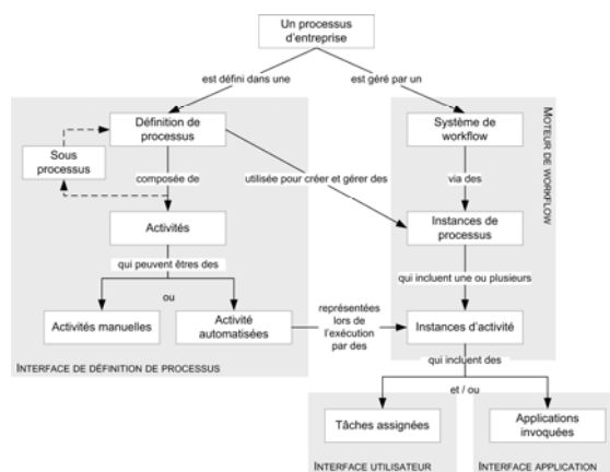
Schéma de fonctionnement d'un système de workflow