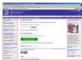
Site Internet de l'OCOSP : www.orientation.vd.ch