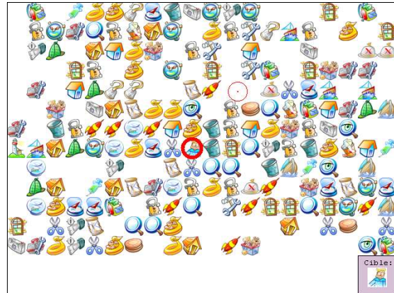
Recherche de cible parmi des distracteurs

Le paradigme de rééducation utilisé dans notre programme est une amélioration d'un paradigme déjà éprouvé. Il s'agit de présenter au patient une image dans la partie de son champ visuel non négligée et de déplacer progressivement cette image dans la zone négligée.