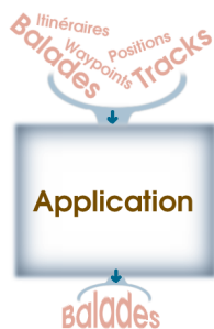
Principe de l'application

De nombreux sites Web proposent des randonnées à leurs utilisateurs. Malheureusement, celles-ci sont statiques, il est impossible de prendre des fragments de randonnées pour en créer de nouvelles. Mon projet de diplôme s'occupe de résoudre ce problème.